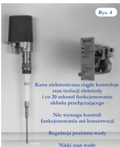
Rys. 4: Samokontrolujący elektrodowy ogranicznik poziomu wody nie wymagający konserwacji ani kontroli funkcjonowania.

Te urządzenia nie wymagają ani codziennych kontroli ani co półrocznych badań przez rzeczoznawcę. Ich funkcjonowanie jest sprawdzane przez serwis producenta kotła specjalnym przyciskiem kontrolnym.