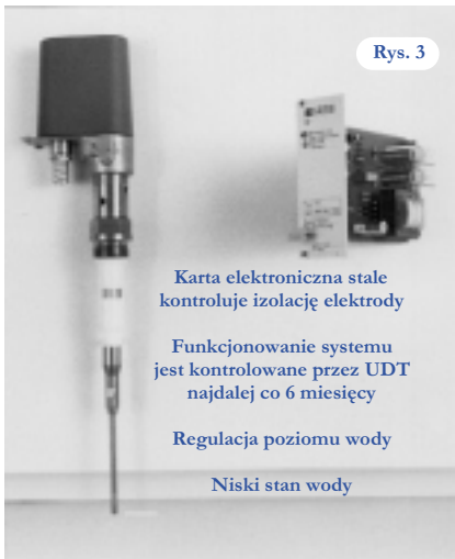
Rys. 3: Dwukanałowy elektrodowy ogranicznik poziomu wody jest kontrolowany najdalej co 6 miesięcy przez UDT.

Bez tej kontroli osoba obsługująca kocioł nie zawsze mogłaby jednoznacznie zdiagnozować awarię kanału.