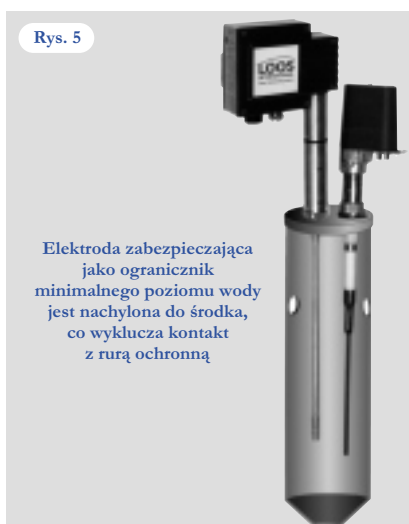
Rys. 5: Układ elektrodowy w rurze ochronnej - trwałą izolacją między elektrodami a rurą ochronną

W takich urządzeniach konieczna jest stała kontrola przez obserwację lustra wody, ponieważ w razie błędu nie nastąpi samoczynne wyłączenie kotła.